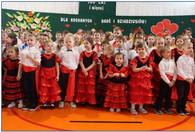
3. w szkole w Sokolinie

Za okazaną miłość, życzliwość, nieoszacowane pokłady cierpliwości uczniowie szkół z terenu gminy podziękowali swoim Babciom i Dziadziusiom podczas uroczystości szkolnych. Były przedstawienia, z głębi serca płynące życzenia i drobne upominki. W tych ciepłych spotkaniach uczestniczyła również Pani Wójt wraz z Panem Przewodniczącym, którzy złożyli życzenia oraz podkreślili wagę roli, jaką pełnią Babcie i Dziadkowie w wychowaniu młodego pokolenia.