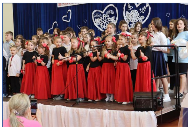
2. w szkole w Czarnocinie