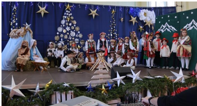
1. Dzień Babci i Dziadka w szkole w Cieszkowach

„Kochane Babcie – drodzy Dziadkowie”. Styczeń to czas, w którym celebруем wyjątkowe dni – Dzień Babci i Dzień Dziadka.